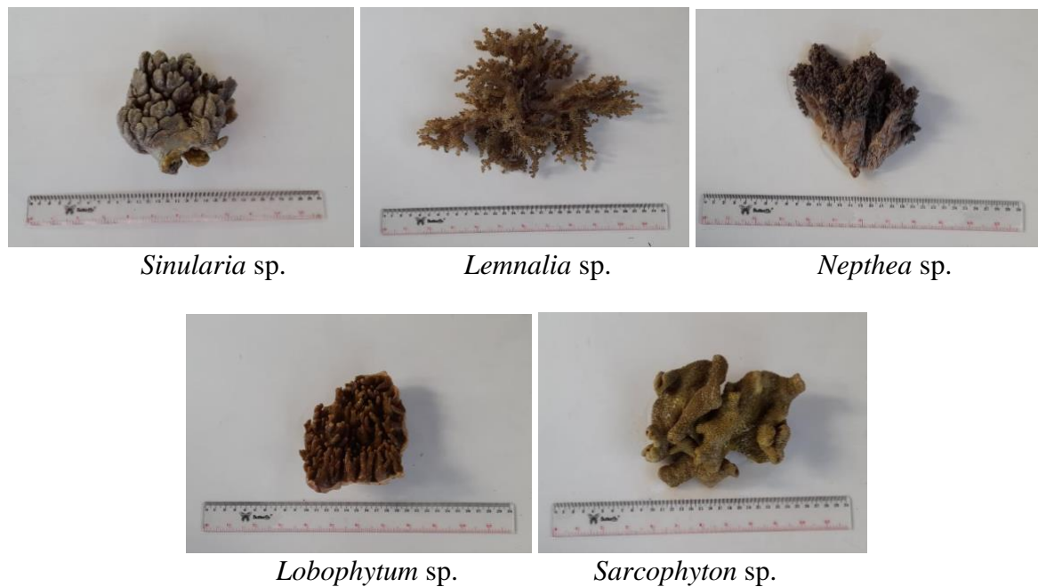
Gambar 1. Koleksi contoh karang lunak yang ditemukan di perairan P. Pahawang, Lampung